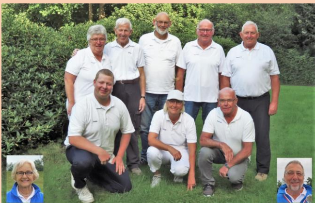
Die Breklumer Mannschaft – Meister Oberliga A 2021

Start war am 29. Mai 2021 in Lockstedt. Beide Begegnungen mit jeweils 5 Spielen gegen den SSV Brammer und gegen Nordboules PC Kiel gewannen die Geest-Bouler mit 4:1.