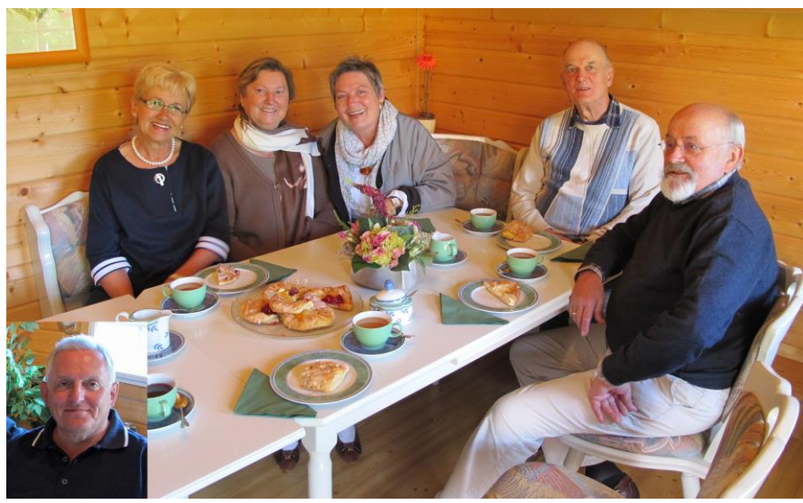
Gründungsversammlung am 25. Mai 2011