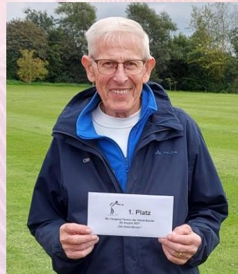
28.08.2021 – 80. Chapeau-Turnier Otto Hansen