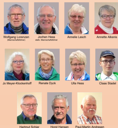
Regionalliga-Team der Geest-Bouler 2021

Nach der Wiederaufnahme des Ligaspiels am 1. April 2021 begann der weitere Aufstieg der Geest-Bouler in der Pétanque-Oberliga A. Die Gegner kamen aus Heide, Neumünster, Kiel, Boostedt, Brammer, Idstedt und Hamburg.