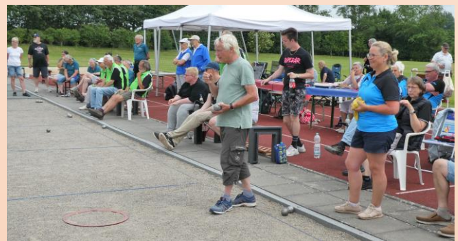
19.6.2021 - Spieltag in Breklum

Gegen die Mannschaften des Idstedter PC und von Torpedo Rote Sau Neumünster gewannen die Breklumer jeweils mit 5:0 ihre Spiele. Das Spiel gegen das Bouleteam des Hamburger Rugby Clubs ging mit 4:1 ebenfalls an die Breklumer.