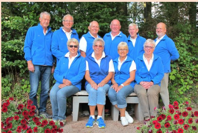
Meister 2018 in der Regionalliga D – Team Geest-Bouler Breklum

Die Geest-Bouler haben am am 1. April 2018 mit dem Ligaspielbetrieb in der Regionalliga D des Pétanque Verbandes Nord erstmals begonnen. Noch im selben Jahr wurden die Spielerinnen und Spieler der Boulesparte des SV Germania Breklum ungeschlagen Meister in ihrer Spielklasse und stiegen in die Oberliga A auf.