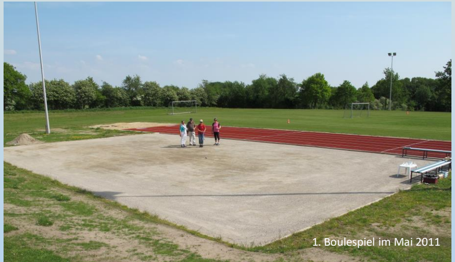
1. Boulespiel im Mai 2011