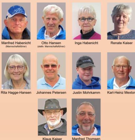
Oberliga-Team der Geest-Bouler 2021

Die Geest-Bouler gründeten 2021 eine zweite Ligamannschaft, die noch im selben Jahr in der Regionalliga C ihr Debüt feierte.