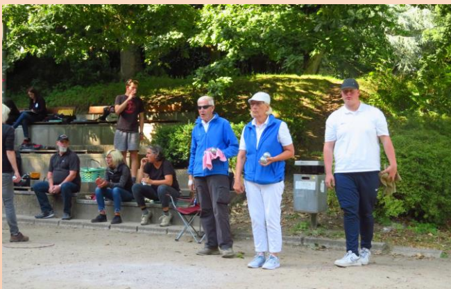
4.9.2021 - Spieltag in Heide – SV Boostedt vs. Breklum

Am letzten Spieltag, dem 4. September 2021, hatte Heide einen Heimvorteil.