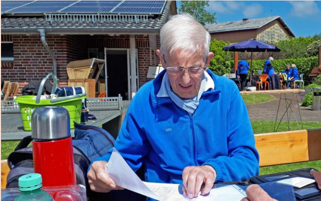
29.5.2021 - Spieltag in Lockstedt - SSV Brammer vs. Breklum

Gegen jeden der v.g. sechs Verein sind fünf Spiele, 1 x Triplette, 1 x Triplette mixte, 2 x Doublette und 1 x Doublette mixte zu spielen. Gewinner in einer solchen Begegnung ist das Team, welches drei von fünf Spielen gewonnen hat. Alle Spiele werden an drei Spieltagen durchgeführt.